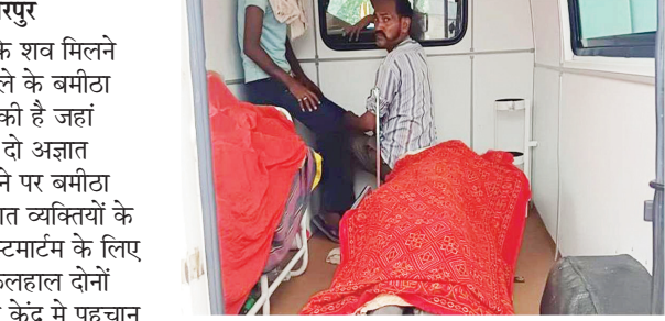
बताई जा रही है। बमीटा थाना पुलिस मामले में मार्ग कायम कर जांच में जुट गई है।

हिंदमाता नेटवर्क @ छतरपुर बागेश्वरधाम में दो अज्ञात व्यक्तियों के शव मिलने का मामला सामने आया है। घटना जिले के बमीटा थाना क्षेत्र के बागेश्वर धाम गढ़ा गांव की है जहां शुक्रवार सुबह प्रवचन पंडाल के नीचे दो अज्ञात व्यक्तियों के शव मिले हैं। सूचना मिलने पर बमीटा पुलिस ने मौके पर पहुंचकर दोनों अज्ञात व्यक्तियों के शवों का मौके पर पंचनामा भरकर पोस्टमार्टम के लिए राजनगर स्वास्थ्य केंद्र भेजा गया है। फिलहाल दोनों व्यक्तियों के शवों को राजनगर स्वास्थ्य केंद्र में पहचान के लिए रखा गया है। मृतकों में एक व्यक्ति की उम्र 35 साल एवं दूसरे व्यक्ति की उम्र 60 साल के करीब