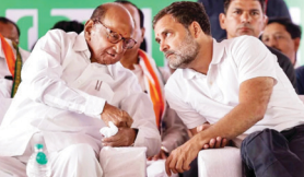
शरद पवार बीजेपी के साथ जाएंगे या कांग्रेस के?

हिंदमता नेटवर्क @ मुंबई महाराष्ट्र की राजनीति से शरद पवार को लेकर कई तरह की खबरें आ रही हैं। एक खबर तो शरद पवार की पार्टी एनसीपी (एसपी) के कांग्रेस में विलय से जुड़ी है। दूसरी खबर है, ममता बनर्जी और उद्धव ठाकरे के बाद अब शरद पवार की पार्टी का नंबर है - और तीसरी खबर है, मुम्किन है बची हुई राजनीतिक पूंजी की हिफाजत के लिए शरद पवार अपना राजनीतिक स्टैंड बदल दें। संसद के मनीसून सत्र से पहले एक बात पर जोरदार चर्चा है कि ममता बनर्जी और उद्धव ठाकरे के बाद अगला नंबर किसका है? असल में केंद्र की बीजेपी सरकार महिला