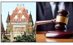
हाई कोर्ट ने एक अहम फैसले में दिवंगत मैरीटाइम इंजीनियर के परिवार को दिए जाने वाले मुआवजे की राशि को बढ़ा दिया है। अदालत ने यह फैसला इस आधार पर दिया कि समुद्री क्षेत्र में काम करने वाले प्रोफेशनलस की आय सामान्य भूमि-आधारित नौकरियों की तुलना में काफी अधिक होती है, और इनके परिवारों को मुआवजे के अधिकारों को बढ़ा देना चाहिए।

हिंदमाता संवाददाता @ मुंबई बॉम्बे हाई कोर्ट ने एक अहम फैसले में दिवंगत मैरीटाइम इंजीनियर के परिवार को दिए जाने वाले मुआवजे की राशि को बढ़ा दिया है। अदालत ने यह फैसला इस आधार पर दिया कि समुद्री (मैरीटाइम) क्षेत्र में काम करने वाले प्रोफेशनलस की आय सामान्य भूमि-आधारित नौकरियों की तुलना में काफी अधिक होती है, और इनके परिवारों को मुआवजे के अधिकारों को बढ़ा देना चाहिए।