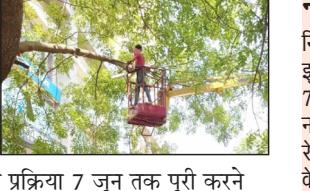
मुंबई में मानसून के दौरान पेड़ों के गिरने से होने वाली दुर्घटनाओं को रोकने के लिए बीएमसी के उद्यान विभाग द्वारा अब तक शहर में 26,672 पेड़ों की छांटई पूरी कर ली गई है। शेष पेड़ों की छांटई और सूखे पेड़ों को हटाने की प्रक्रिया 7 जून तक पूरी करने का लक्ष्य प्रशासन ने तय किया है, ऐसी जानकारी उद्यान विभाग की ओर से दी गई है।

हिंदमाता संवाददाता @ मुंबई मुंबई में मानसून के दौरान पेड़ों के गिरने से होने वाली दुर्घटनाओं को रोकने के लिए बीएमसी के उद्यान विभाग द्वारा अब तक शहर में 26,672 पेड़ों की छांटई पूरी कर ली गई है। शेष पेड़ों की छांटई और सूखे पेड़ों को हटाने की प्रक्रिया 7 जून तक पूरी करने का लक्ष्य प्रशासन ने तय किया है, ऐसी जानकारी उद्यान विभाग की ओर से दी गई है। मुंबई मनापा द्वारा मानसून पूर्व किए गए विशेष सर्वेक्षण में शहर की सड़कों के किनारे स्थित कुल 1,90,296 पेड़ों का निरीक्षण किया गया। इसमें 513 पेड़ अत्यंत खतरनाक या सूखे होने की अवस्था में पाए गए थे। इनमें से अब तक 296 पेड़ों को पूरी तरह हटाया जा चुका है। वहीं, इस वर्ष निजी परिसरों और रेलवे क्षेत्र के पेड़ों को लेकर भी विशेष सावधानी बरती जा रही है।