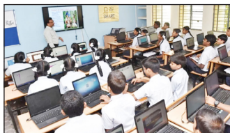
मुंबई में अंग्रेजी माध्यम के स्कूलों में एडमिशन की मांग लगातार बढ़ रही है, जिससे बड़ी संख्या में छात्रों को प्रवेश पाने में कठिनाई का सामना करना पड़ रहा है।

हिंदमाता संवाददाता @ मुंबई मुंबई में अंग्रेजी माध्यम के स्कूलों में एडमिशन की मांग लगातार बढ़ रही है, जिससे बड़ी संख्या में छात्रों को प्रवेश पाने में कठिनाई का सामना करना पड़ रहा है। इस स्थिति को देखते हुए बृहन्मुंबई महानगरपालिका के शिक्षा विभाग ने एक अहम निर्णय लिया है। अब सीबीएसई और आईसीएसई बोर्ड के स्कूलों में नर्सरी से लेकर 10वीं कक्षा तक प्रत्येक कक्षा में 4 अतिरिक्त सेक्शन शुरू करने की योजना बनाई गई है।