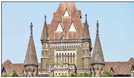
हाईकोर्ट ने सरकारी अधिकारियों की इस हिम्मत पर गहरी चिंता व्यक्त करते हुए कहा है कि कानून का मजाक बर्दाश्त नहीं किया जाएगा।