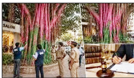
बृहन्मुंबई महानगरपालिका के गार्डन विभाग ने बॉटल पुलिस से एक सैलून के खिलाफ कार्रवाई की मांग की है। यह मामला तब सामने आया जब आरोप लगा कि सैलून ने अपनी दुकान के बाहर स्थित एक जीवित बरगद के पेड़ को रंग दिया था।

हिंदमाता संवाददाता @ मुंबई बृहन्मुंबई महानगरपालिका के गार्डन विभाग ने बॉटल पुलिस से एक सैलून के खिलाफ कार्रवाई की मांग की है। यह मामला तब सामने आया जब आरोप लगा कि सैलून ने अपनी दुकान के बाहर स्थित एक जीवित बरगद के पेड़ को रंग दिया था। इस घटना के बाद सिविक बॉडी ने सैलून को नोटिस जारी कर दिया है और उससे जवाब तलब किया गया है। मामला मुंबई के पाली नाका क्षेत्र में स्थित 'टिप एंड टो लक्स सैलून' से जुड़ा है। बृहन्मुंबई महानगरपालिका के अनुसार, सैलून पर आरोप है कि उसने पेड़ के तने और ऊपर की जड़ों को सजावटी उद्देश्य से गुलाबी और हरे रंग से पेंट कराया। इस काम के लिए कर्मचारियों को भी लगाया गया था।