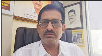
महापौर के शासकीय निवासस्थान (बंगले) के नवीनीकरण के लिए वर्ष 2026-27 में करीब 3.40 करोड़ रुपये खर्च करने का प्रस्ताव सामने आया है। यह जानकारी सूचना के अधिकार के तहत उजागर हुई है, जिसे मुंबई महानगरपालिका ने आरटीआई कार्यकर्ता अनिल गलानी को उपलब्ध कराया है।

हिंदमाता संवाददाता @ मुंबई महापौर के शासकीय निवासस्थान (बंगले) के नवीनीकरण के लिए वर्ष 2026-27 में करीब 3.40 करोड़ रुपये खर्च करने का प्रस्ताव सामने आया है। यह जानकारी सूचना के अधिकार के तहत उजागर हुई है, जिसे मुंबई महानगरपालिका ने आरटीआई कार्यकर्ता अनिल गलानी को उपलब्ध कराया है। महापौर बंगले के खर्च में 4 गुना वृद्धि हुई है, जो 85 लाख से बढ़कर सीधे 3.40 करोड़ का प्रस्ताव लाया गया है। उपलब्ध आंकड़ों के अनुसार, पिछले कुछ वर्षों में महापौर बंगले पर खर्च बेहद सीमित रहा है। वर्ष 2018-19 में कुल 85.87 लाख रुपये खर्च हुए थे। इसके बाद वर्ष 2019-20 में खर्च घटकर 5.88 लाख रुपये रह गया, जबकि 2020-21 और 2022-23 में यह क्रमशः 2.93 लाख और 2.92 लाख रुपये रहा। इसके मुकाबले 2026-27 के लिए प्रस्तावित 340 लाख रुपये (3.40 करोड़) का खर्च 4 गुना तक की वृद्धि दर्शाता है।