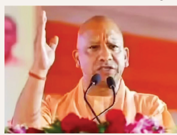
जांच दल गठित किए जाने का अनुरोध किया था। ट्रस्ट के अनुसार अफवाहों पर रोक लगाने और मामले की सच्चाई सामने लाने के लिए इसकी गहन जांच आवश्यक है। यह तीर्थ क्षेत्र की छवि और करोड़ों श्रद्धालुओं की आस्था को चोट पहुंचाने की गहरी साजिश है, जिसका पदाफाश होना बेहद जरूरी है।