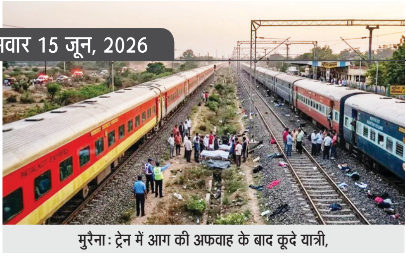
मुरैना : ट्रेन में आग की अफवाह के बाद कूदे यात्री,

दिल्ली की मुख्यमंत्री रेखा गुप्ता ने यमुना सफाई अभियान में शामिल होकर लोगों से नदी को स्वच्छ बनाए रखने की अपील की। उन्होंने कहा कि कई सामाजिक संस्थाओं के स्वयंसेवकों और भाजपा कार्यकर्ताओं ने श्रमदान कर यमुना नदी की सफाई में हिस्सा लिया। मुख्यमंत्री ने बताया कि सुबह 6 बजे से लगातार सफाई अभियान चलाया जा रहा है और अब तक सैकड़ों टन कूड़ा नदी से बाहर निकाला जा चुका है। उन्होंने लोगों से धार्मिक सामग्री और कूड़ा यमुना में न डालने की अपील करते हुए कहा कि घर की पूजन सामग्री यमुना में विसर्जित करके हम किसी भी भगवान को खुश नहीं कर सकते। अगर यमुना मां गंदी होगी तो कोई भी भगवान प्रसन्न नहीं होंगे। रेखा गुप्ता ने कहा कि यमुना को स्वच्छ रखने की जिम्मेदारी सिर्फ सरकार की नहीं बल्कि हर नागरिक की है। उन्होंने कहा कि सरकार पूरी मुस्तैदी से अपना काम कर रही है और लोगों को भी अपनी जिम्मेदारी समझनी होगी। मुख्यमंत्री ने बताया कि यह स्वच्छता अभियान लगातार जारी रहेगा और समय-समय पर लोगों को इस्म में शामिल होने के लिए आमंत्रित किया जाएगा। उन्होंने कहा कि जनभागीदारी से ही यमुना को साफ और प्रदूषण मुक्त बनाया जा सकता है।